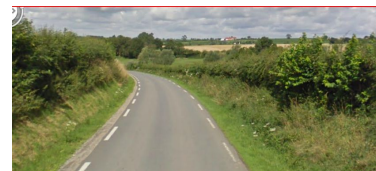
Illustration 8: Quelque part vers le collège 1 route la plus longue et la plus large