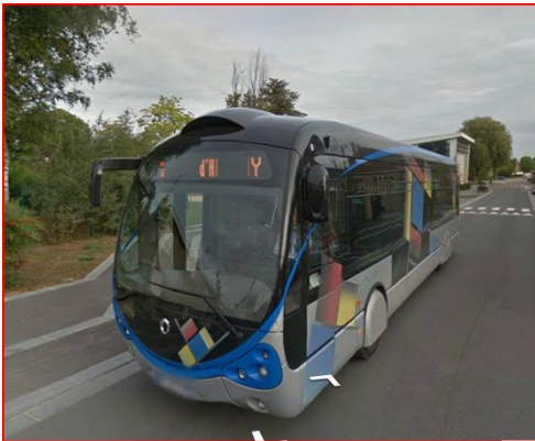
l'agglomération urbaine (30 km le long de la rivière)