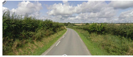
Illustration 1: vers le collège