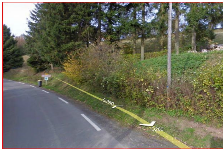
Illustration 9: Entre les deux collèges