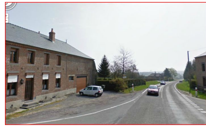
Illustration 4: Vers le collège 1