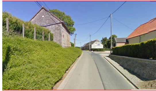
Illustration 3: traversée de village