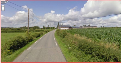
Illustration 2: vers le collège un

6 : E n t r e l e s d e u x c o l l è g e s